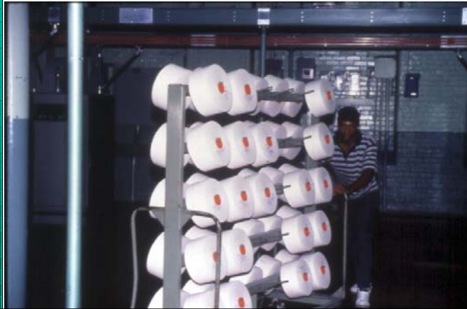
紡紗後紗纏繞在紗管上 (準備織布)