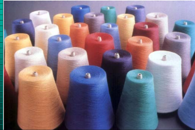
紗於織布前先染色